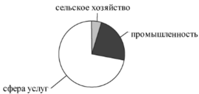
Структура занятости населения по секторам экономики

Для какой из перечисленных стран характерна структура занятости населения, показанная на диаграмме?